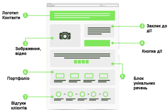
Малюнок 1. Структура landing-page.

Так виглядає стандартна схема довгих сторінок. Вона не містить зайвих посилань, неважливої інформації і тому приваблива для користувачів.